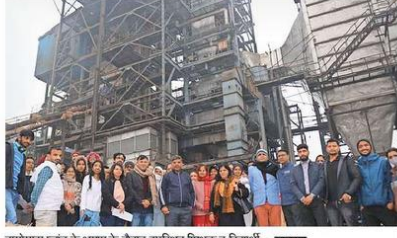
बायोमास प्लांट के भ्रमण के दौरान उपस्थित शिक्षक व विद्यार्थी