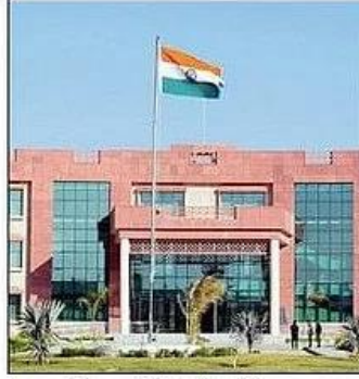
हरियाणा केंद्रीय विश्वविद्यालय महेंद्रगढ़