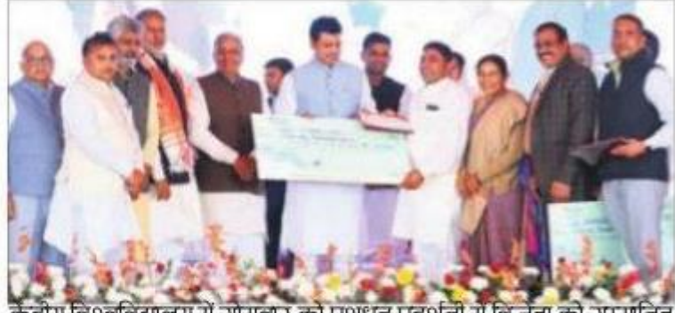
केंद्रीय विश्वविद्यालय में सोमवार को पशुधन प्रदर्शनी में विजिता को सम्मानित करते मुख्य अतिथि बिप्लब कुमार देब।

पशुपालन विभाग द्वारा लगाई गई प्रदर्शनी की सराहना करते हुए कहा