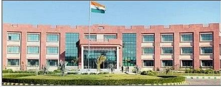
हरियाणा केंद्रीय विश्वविद्यालय महेंद्रगढ़। स्रोत: विवि

जनवरी से तिथि बढ़ाकर विद्यार्थियों को दी राहत