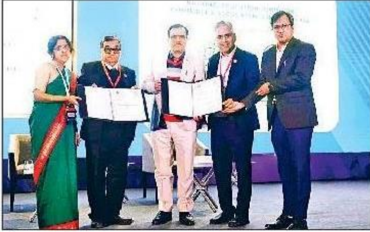
महेंद्रगढ़। समझौता ज्ञापन हस्तांतरित करते हुए विश्वविद्यालय व आईसीएआई के अधिकारी।