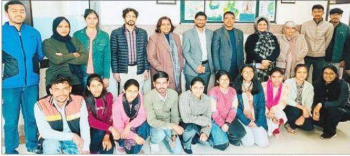
पोस्टर मेकिंग प्रतियोगिता के अवसर पर उपस्थित शिक्षक, विद्यार्थी व शोधार्थी।