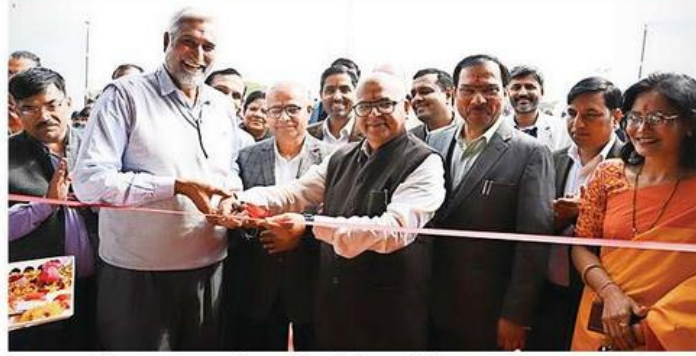
विज्ञान प्रदर्शनी का उद्घाटन करते कुलपति व विशिष्ट अतिथि • जागरण

• स्कूली व विश्वविद्यालय के विद्यार्थियों ने प्रस्तुत की अपनी उपलब्धियां