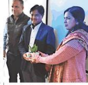
स्मृति चिह्न देते हुए • जकारण

हकेंवि में विशेषतः व्याख्यान का हुआ आयोजन