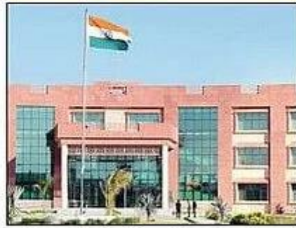
हरियाणा केंद्रीय विश्वविद्यालय । आकाईव

अतिथि गृह, स्वास्थ्य केंद्र, कर्मचारी आवासों का होगा उद्घाटन