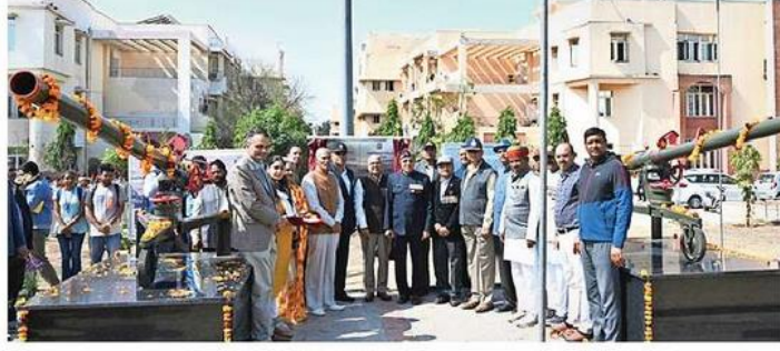
हरियाणा केंद्रीय विश्वविद्यालय में रिकाइललेस लांचर का अनावरण करते हुए