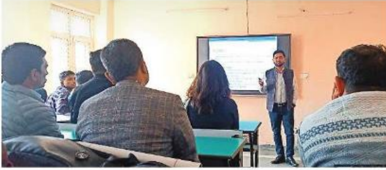
हरियाणा केंद्रीय विश्वविद्यालय में प्रतिभागियों को संबोधित करते विशेषज्ञ