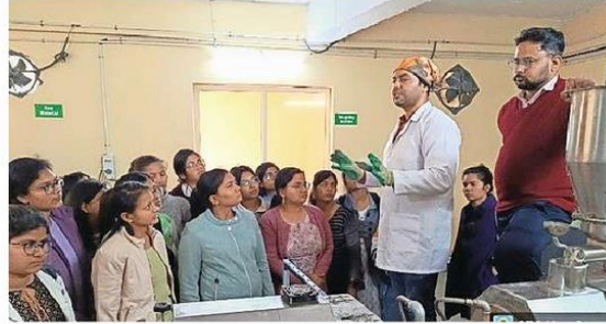
निफ्टेम में राइस फोर्टिफिकेशन का प्रशिक्षण लेते हकैवि के विद्यार्थी • जागरण

संवाद सहयोगी, महेंद्रगढ़: हरियाणा केंद्रीय विश्वविद्यालय (हकैवि) के पोषण जीवविज्ञान विभाग के विद्यार्थियों, शोधार्थियों एवं संकाय सदस्यों ने निफ्टेम, कुंडली हरियाणा में राइस फोर्टिफिकेशन पर एक दिवसीय व्यावहारिक प्रशिक्षण कार्यक्रम में प्रतिभागिता की। यह प्रशिक्षण नेशनल इंस्टीट्यूट ऑफ फूड टेक्नोलॉजी एंड एंटरप्रेन्योरशिप मैनेजमेंट, सोनीपत हरियाणा में राइस फोर्टिफिकेशन के लिए इनोवेशन हब के सहयोग से फोर्टिफिकेशन इनोवेशन हब सेंटर ऑफ एक्सीलेंस फूड फोर्टिफिकेशन (एफआईएच-सीईएफएफ) द्वारा आयोजित किया गया था। हरियाणा केंद्रीय विश्वविद्यालय के कुलपति प्रो.