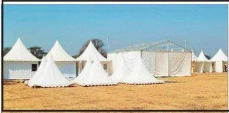
हकेंवि में होने वाली पशुधन प्रदर्शनी को लेकर लगाए जा रहे टेंट।