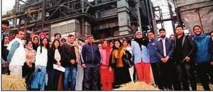
प्लांट के भ्रमण के दौरान उपस्थित शिक्षक व विद्यार्थी।

महेंद्रगढ़। हरियाणा केंद्रीय विश्वविद्यालय (हकेंवि) के पत्रकारिता एवं जनसंचार विभाग एवं पर्यावरण विभाग के विद्यार्थियों ने गांव कुराहवटा में नवीकरणीय ऊर्जा के बायोमास पावर प्लांट का भ्रमण किया। भ्रमण के दौरान विद्यार्थियों ने बायोमास से बिजली उत्पादन की प्रक्रिया को जाना-समझा।