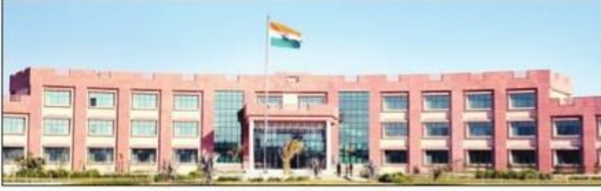
हरियाणा केंद्रीय विश्वविद्यालय महेंद्रगढ़। संवाद