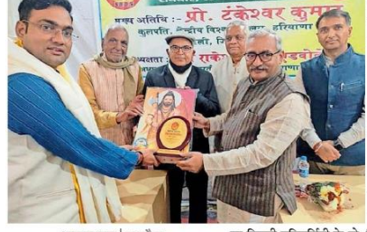
भारत न्यूज | नारनौल

नारनौल में गौड ब्रह्मण सभा में आयोजित गीता महोत्सव में कुलपति का स्मृति चिन्ह देकर सम्मानित करते आयोजक।